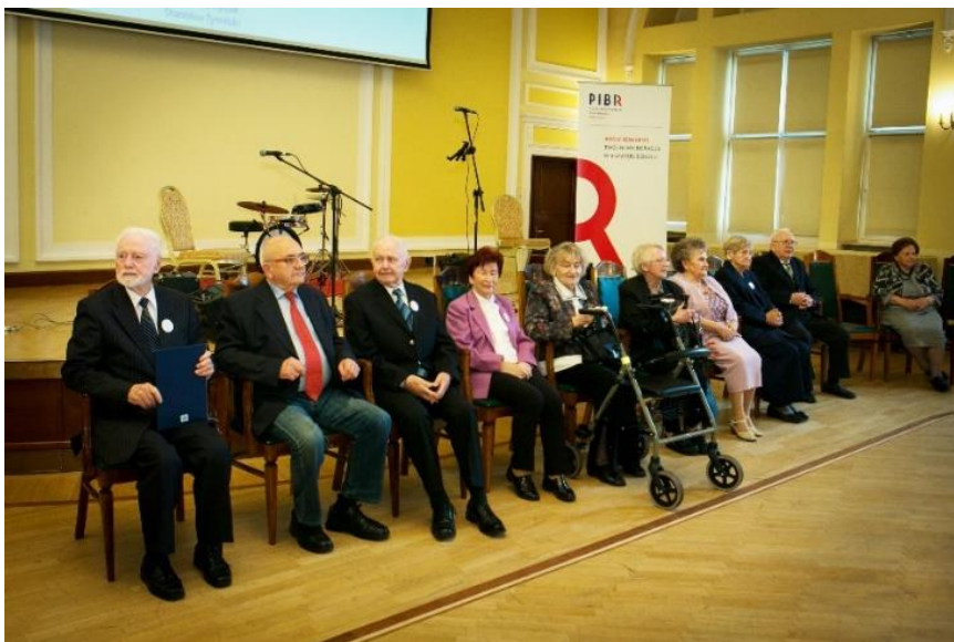
Fot. 1. Łoża Honorowa V Benefisu Bieglego Rewidenta.

W latach 2020-2021 z uwagi na trwającą pandemię organizacja kolejnych Benefisów została czasowo zawieszona.