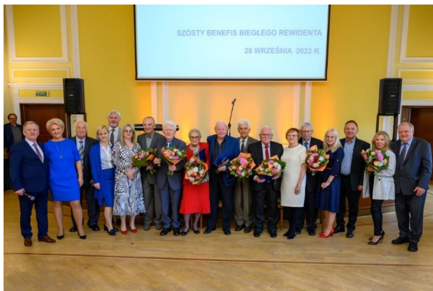
Fot. 2. Łoża Honorowa VI Benefisu Bieglego Rewidenta wraz z Prowadzącymi uroczystość.