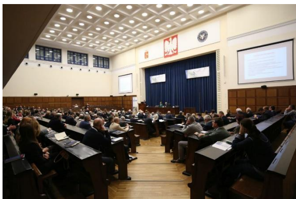
Fot. 3. Czwarty Kongres Nauk Sądowych