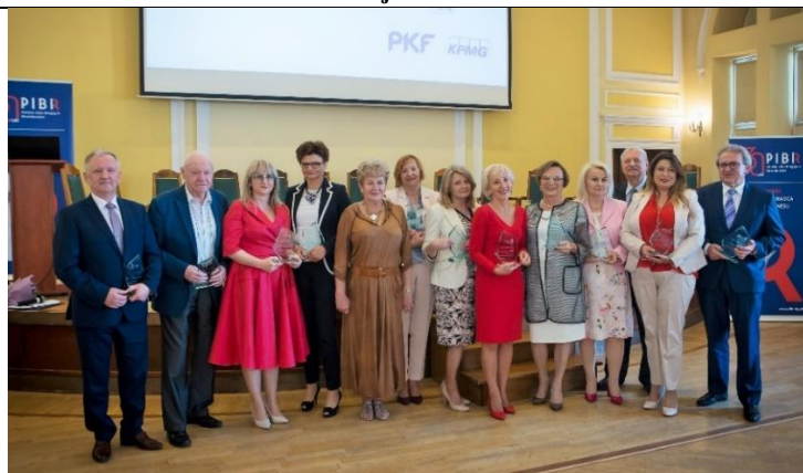
Fot. 6. Uhonorowani biegli rewidentzi na Jubileuszu 30-lecia RO PIBR w Warszawie.

Po części oficjalnej odbył się uroczysty bankiet.