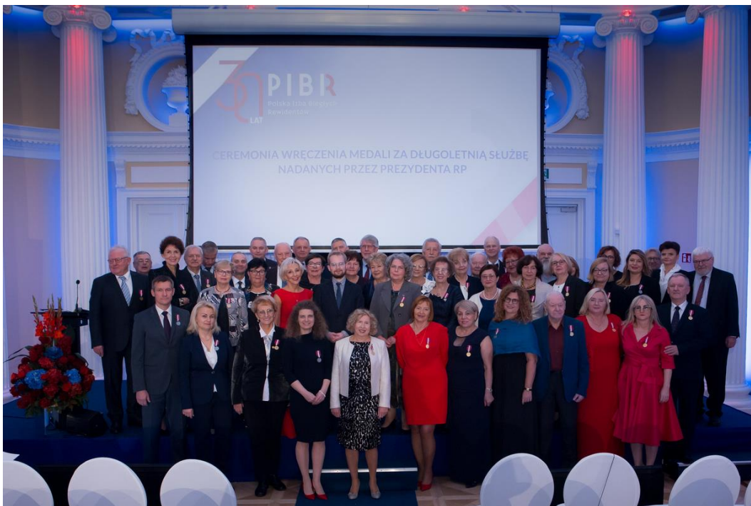
Fot. 5. Odznaczeni Medalami za Długoletnią Służbę na Jubileuszu 30-lecia samorządu biegłych rewidentów.